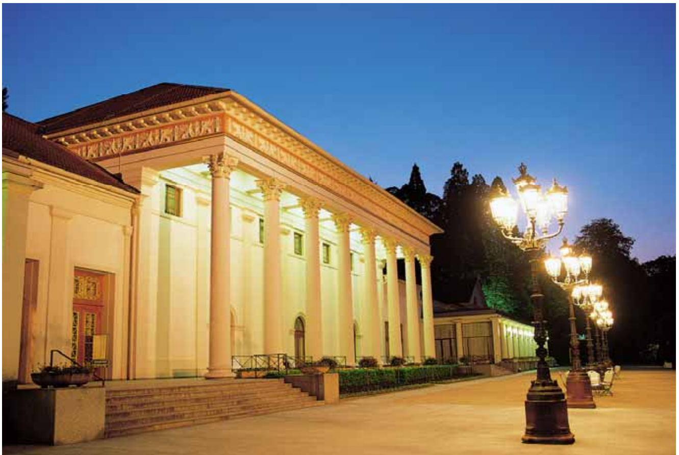
Kurhaus Casino, Baden-Baden