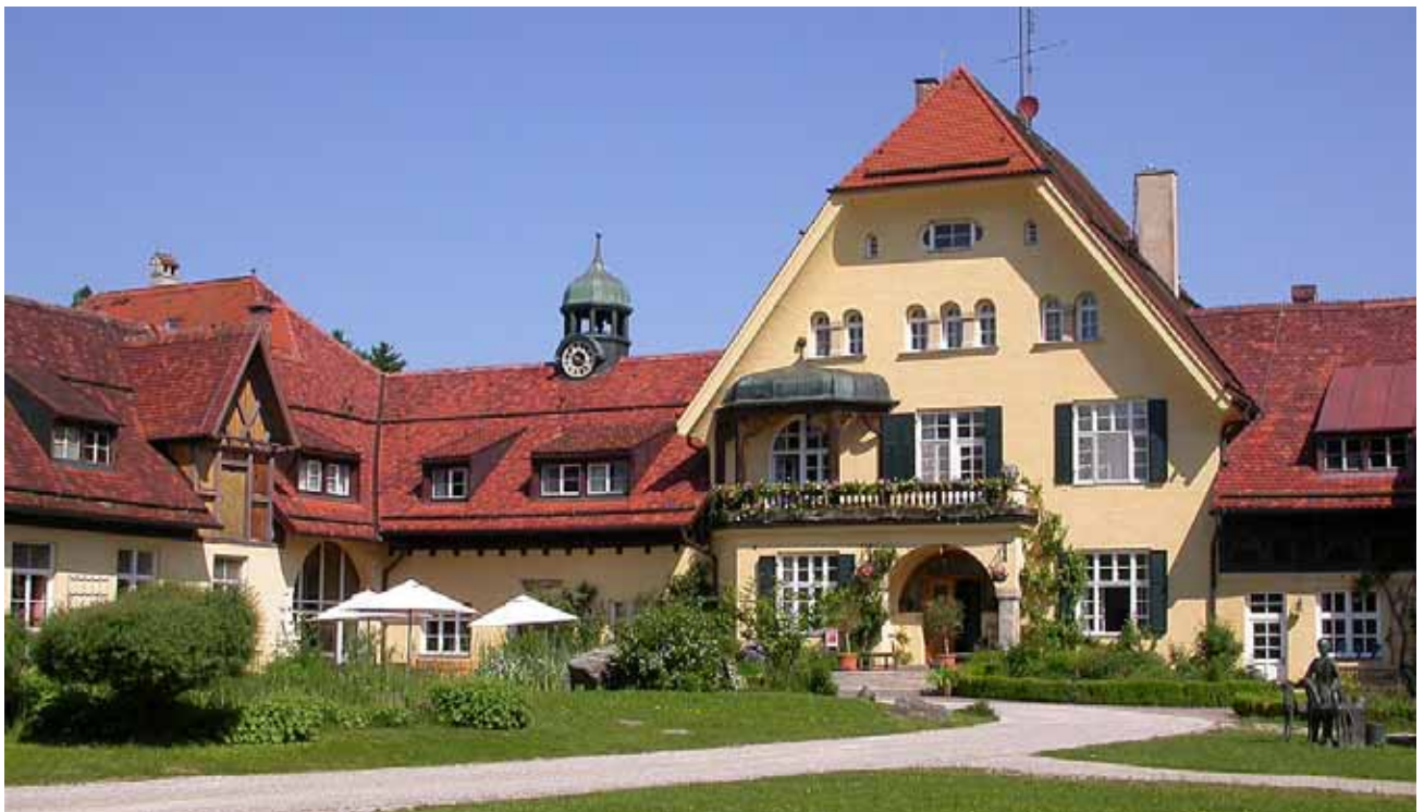
Gut Sonnenhausen, Glonn