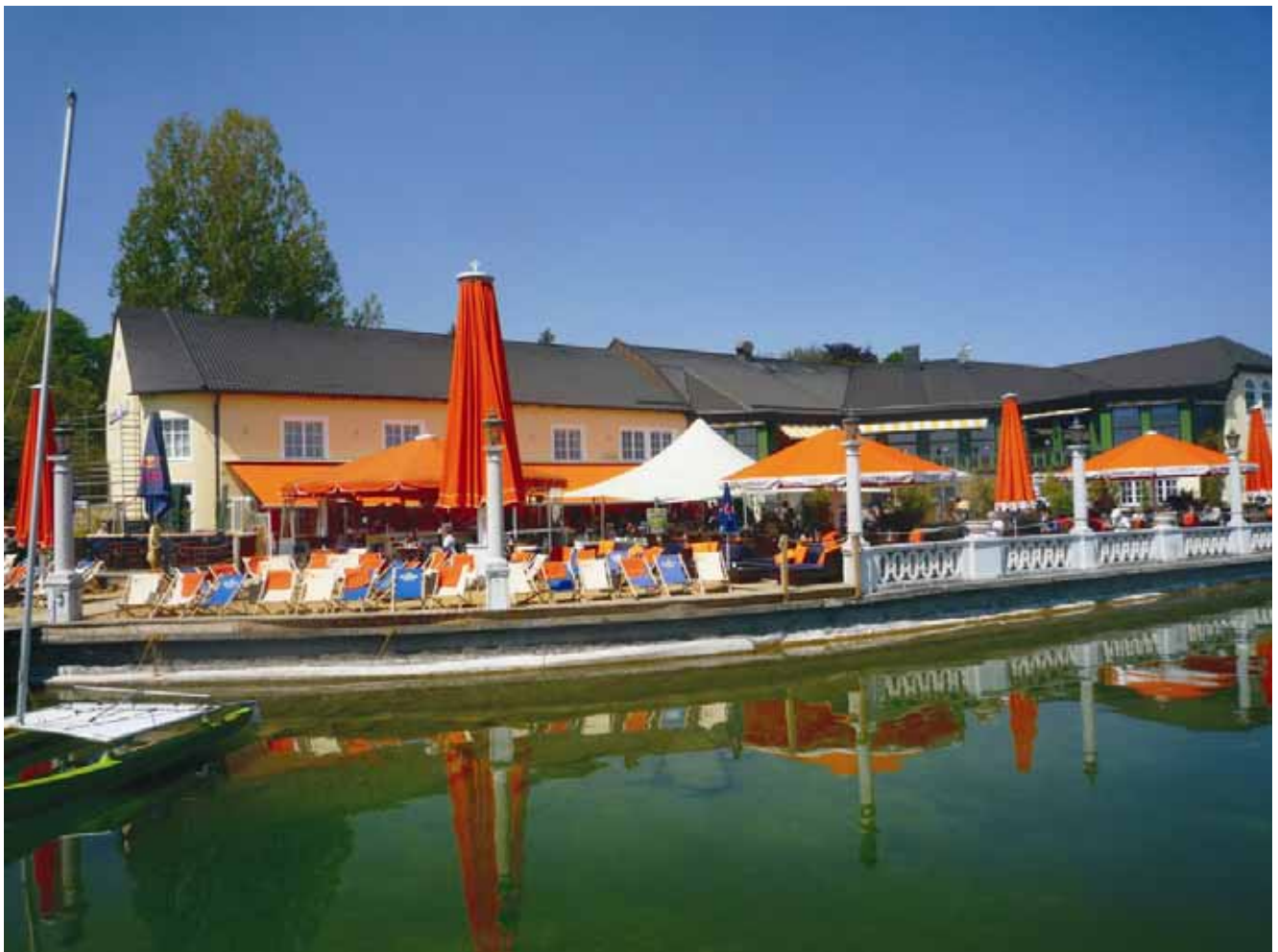
Undosa Erlebnisastronomie, Starnberg

Der Veranstalter behält es sich vor das Programm zu ändern, um es an aktuelle Marktsituationen anpassen zu können.