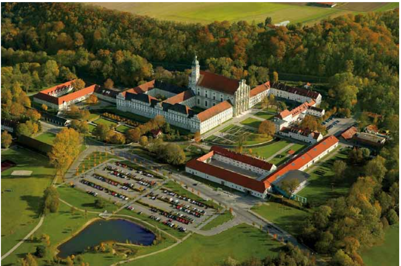
Klosterareal von Fürstenfeld mit Klosterkirche, Fürstenfeldbruck