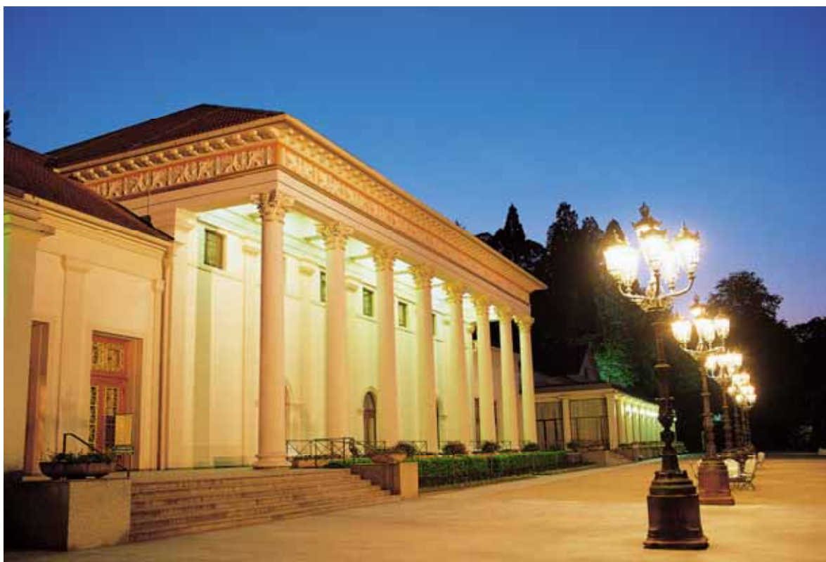
Kurhaus Casino, Baden-Baden